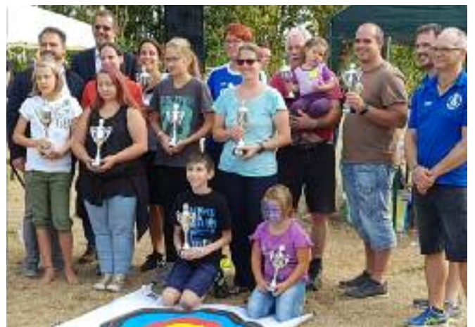
Stadtmeisterschaft im Bogenschießen - Pokalübergabe