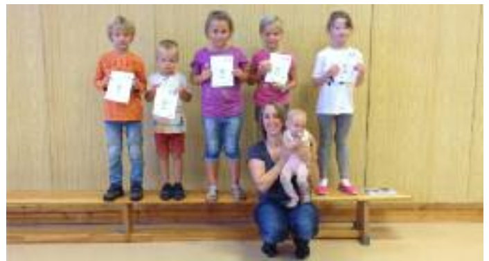
Deutschland bewegt sich

Wir bedanken uns bei der tatkräftigen Unterstützung aller, die uns auf jegliche Art und Weise rund ums Spielfest unterstützt haben. Wir freuen uns auf das kommende 40. Spielfest mit euch.